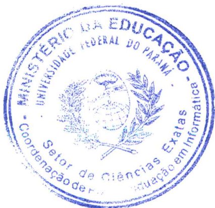
SHEILA MORAIS DE ALMEIDA Avaliador Externo (UTFPR)