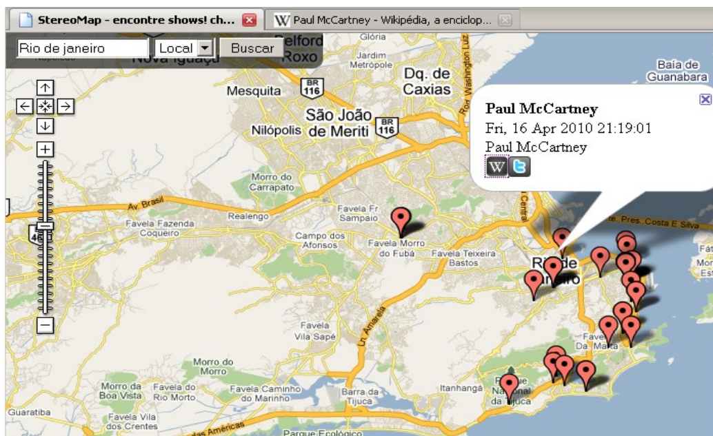
Figura 2: Interface do Stereommap

Google Maps. No canto superior esquerdo há uma caixa de pesquisa, no qual é possível entrar com a cidade de interesse. Os pontos no mapa são as marcações que foram adicionados ao site com o auxílio das informações oriundas do Last.fm. Com a expansão da marcação, o StereoMap possibilita que o usuário acesse o Wikipédia e o Twitter.